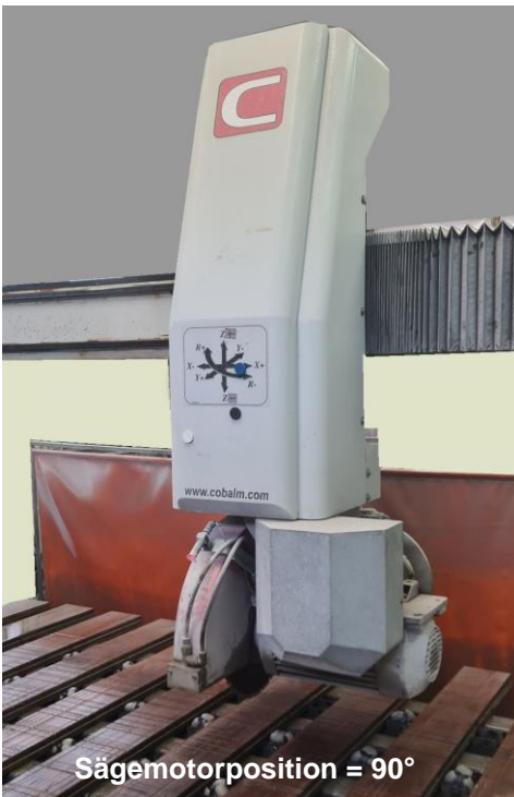
Sägemotorposition = 90°