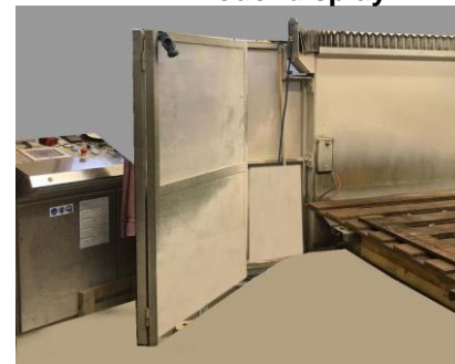
Feuerverzinkter Rahmen inkl. Türen